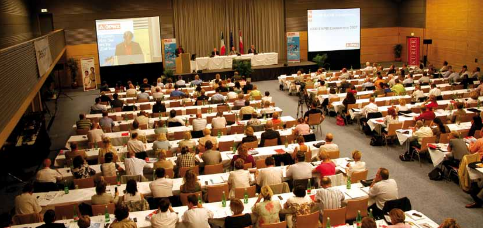
XXIII. Kongress der European Association of Personnel Management (EAPM), Wien, 2007.

2007 wird Wien für vier Tage zur internationalen Drehscheibe für Human-Resource ManagerInnen. Vom 20. bis 22. Juni findet der XXIII. Kongress der European Association of Personnel Management (EAPM) statt.